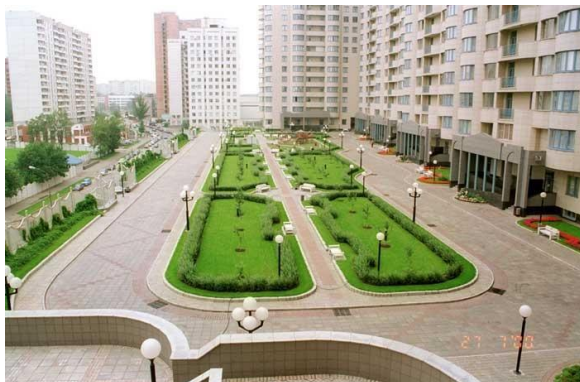
г. Москва Сдан в эксплуатацию в 1997 г.

ЦинКо РУС обеспечивает полный цикл реализации зеленой кровли, от идеи до сдачи готового объекта.